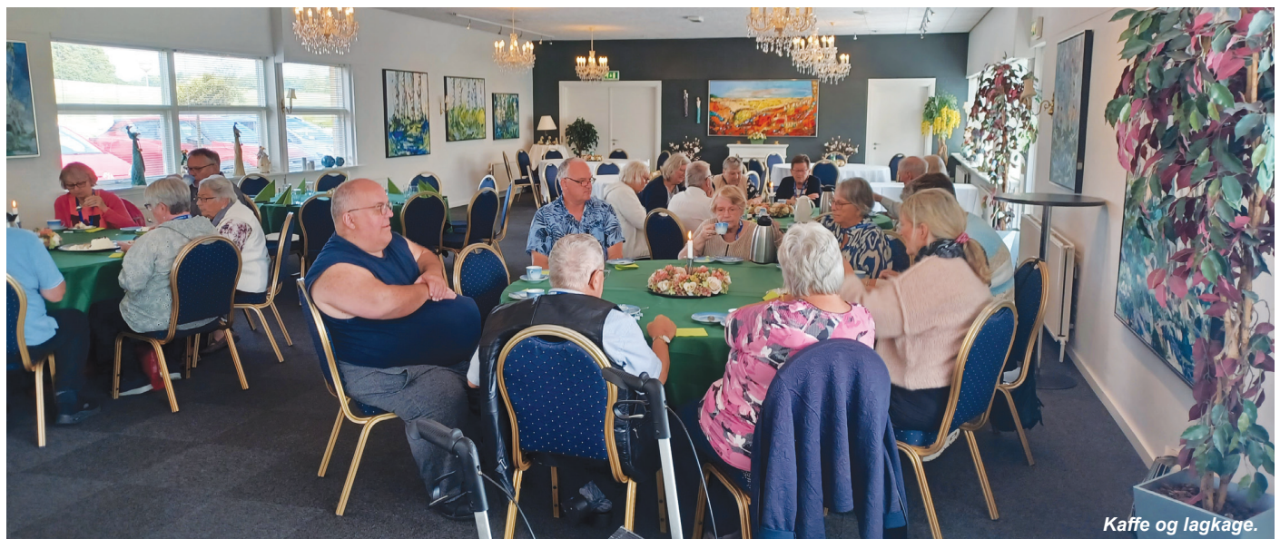
Kaffe og lagkage.

Torsdag aften - vanen tro aftenmenu, kaffe og hygge.