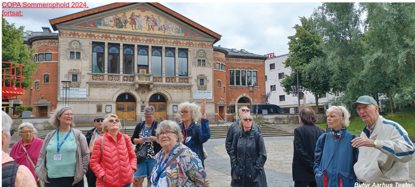
Bytur Aarhus Teater.